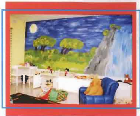
Counselling Room għat-tfal